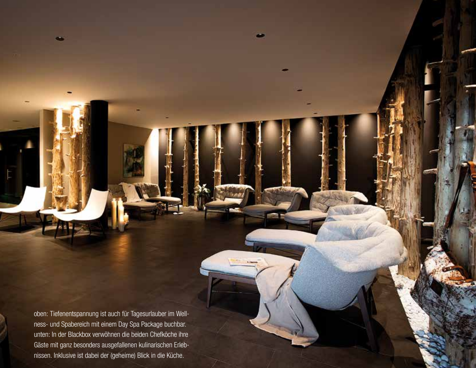
oben: Tiefenentspannung ist auch für Tagesurlauber im Wellness- und Spabereich mit einem Day Spa Package buchbar. unten: In der Blackbox verwöhnen die beiden Chefköche ihre Gäste mit ganz besonders ausgefallenen kulinarischen Erlebnissen. Inklusiv ist dabei der (geheime) Blick in die Küche.