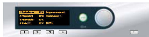
Modus „Standard“: Der Bediener hat Zugriff auf sämtliche Standard- und Zielgruppenprogramme

Das flexible Bedienkonzept der Steuerung Profitronic L Vario erlaubt es gleichzeitig, den Programmmzugriff genau auf die Nutzerkreise mit unterschiedlichen Bedienanforderungen abzustimmen.