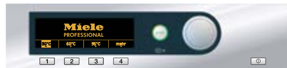
Modus „Direktastenbetrieb und mehr“: Der Bediener kann über die Direktwahl-tasten und Display 12 voreingestellte Programme starten