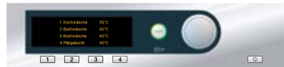
Modus „Direktastenbetrieb“: Der Bediener kann 4 voreingestellte Programme über die Direktwahl-tasten abrufen