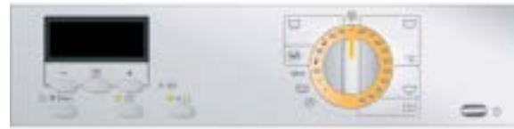
Waschmaschine: Steuerung Profiline B Symbole

Die Maschinen der Baureihe OCTOPLUS bieten mit der Steuerung Profiline B Symbole kompromisslose Leistung für große Textilmengen mit alltäglichen Anschmutzungen. Anwender mit höherem Wäscheaufkommen erzielen so schnell und zuverlässig hervorragende Resultate bei der Wäschepflege.