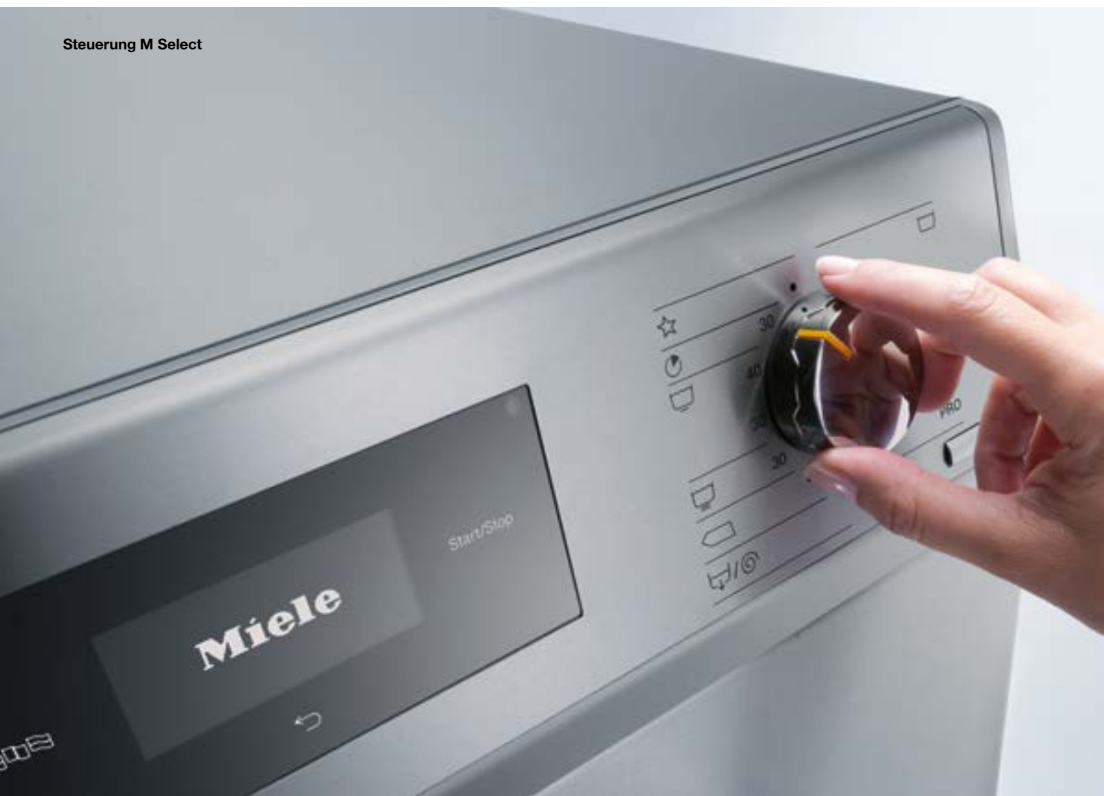
Steuerung M Select

*Nutzung erfordert separat erhältliches, kostenpflichtiges Zubehör und Software. Deren Verfügbarkeit kann je Land variieren. Näheres erfahren Sie bei Ihrem Miele-Vertragshändler oder unter miele.de