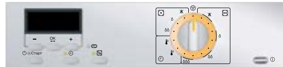
Trockner: Steuerung Profiline B Symbole